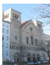
Kath. St. Joseph Gemeinde